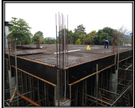
පුලුහව අධිකරණ සංකීර්ණය