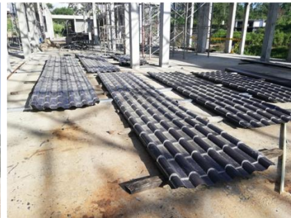
තෙල්දෙණිය අධිකරණ සංකීර්ණය