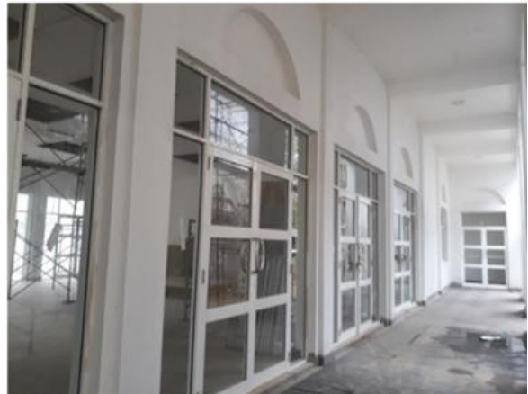
මැදවව්විය අධිකරණ සංකීර්ණය