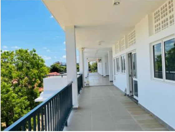
ගම්පොල අධිකරණ සංකීර්ණය